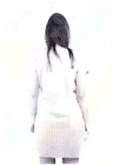
WhatsApp Image 2022-05-27 at 12.22.24 (1).jpeg 71K