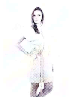
WhatsApp Image 2022-05-27 at 12.22.23.jpeg 69K