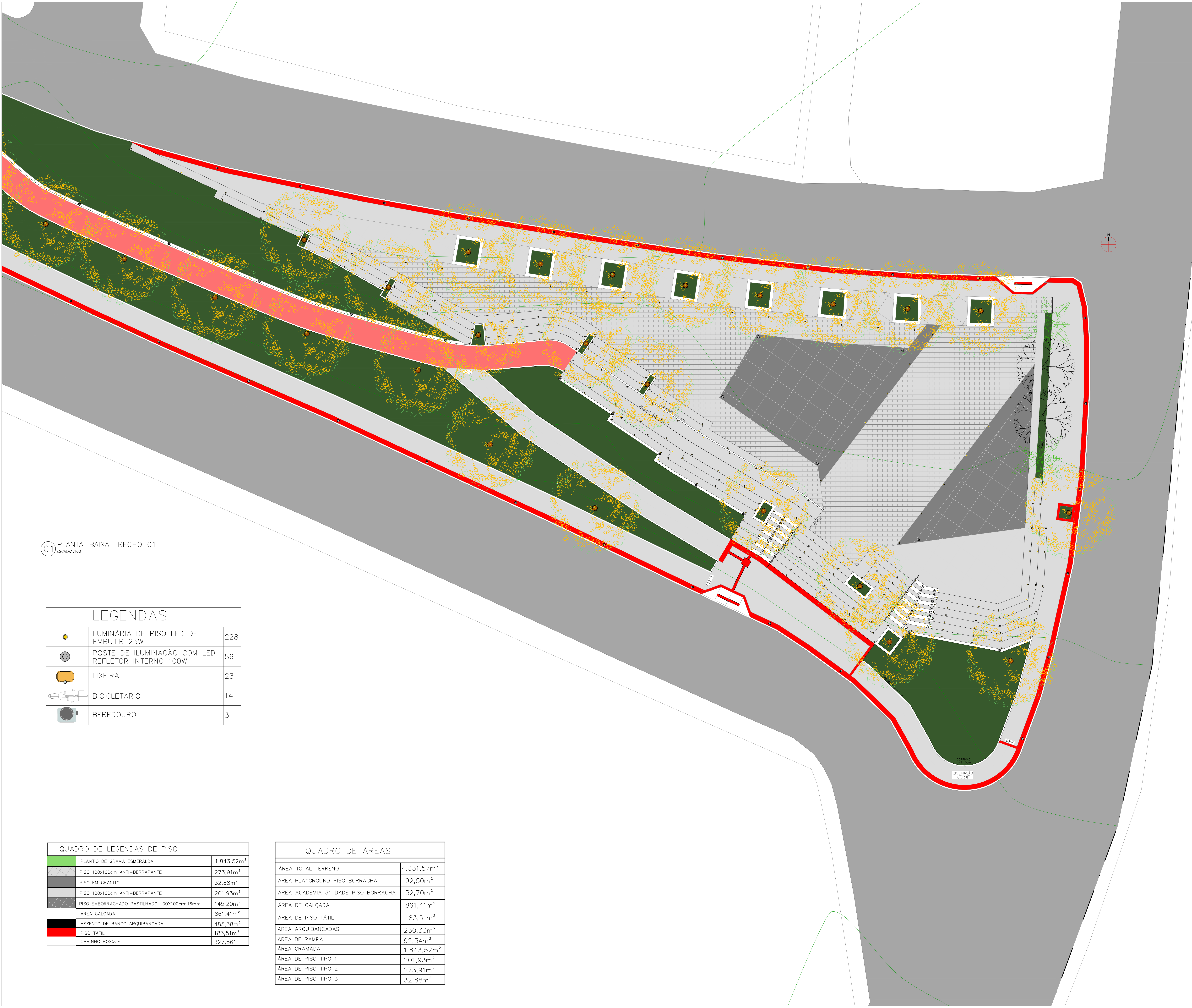
01 PLANTA-BAIXA TRECHO 01 ESCALA 1:100