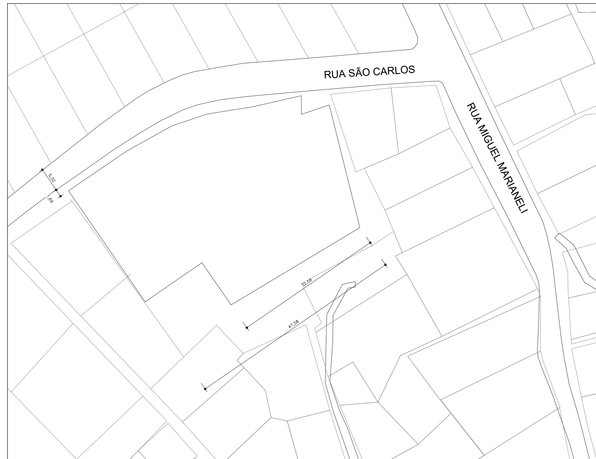
PLANTA DE SITUAÇÃO ESC. 1/500