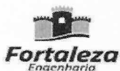
imagem001.png - 19 KB Baixar